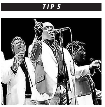
Deep River Quartet.